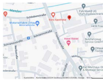
HKW Friedenstraße Schliebenstraße 3, 02763 Zittau