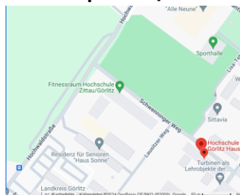
Schwenninger Weg 1 02763 Zittau

Ort/Místo: Wasser/Voda + Kernreaktor + Otto -Haus/Budova Z VII, Schwenninger Weg 1, 02763 Zittau, Wärmespeicher/ Ukládání tepla – Schliebenstraße 3, 02763, Zittau